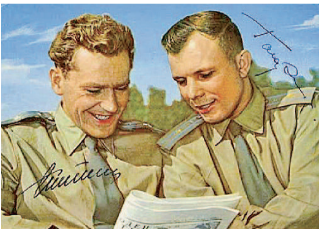
Герман Титов и Юрий Гагарин.

Космонавт с позывным «Орёл» стал первым, кто пробыл в полете более суток и применил ручное управление космическим кораблем. Второй космонавт планеты сделал первые снимки Земли, провел медицинские и биологические эксперименты, а черносмородиновый сок и паштет, стали первой пищей съеденной в условиях невесомости. За 25 часов и 18 минут Герман Титов совершил 17 витков вокруг Земли, после чего, успешно приземлился на парашюте в Саратовской области.