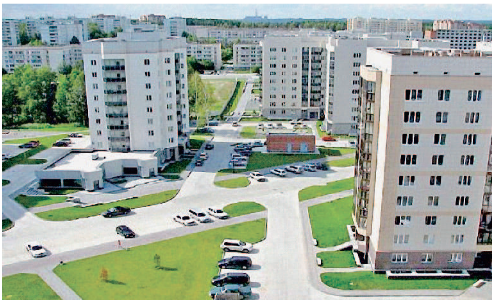
Радиаторы АО «Златмаш» — в многоэтажках крупнейших городов России.